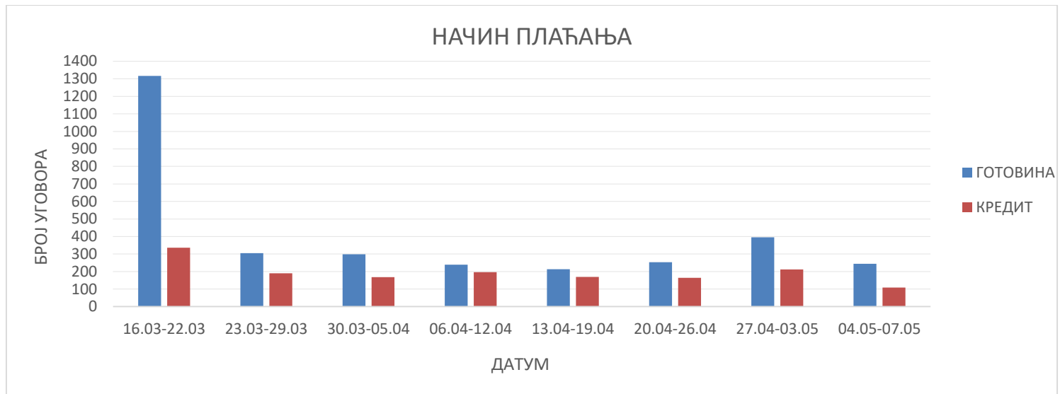
График 2: Број примљених уговора према начину плаћања за период ванредног стања